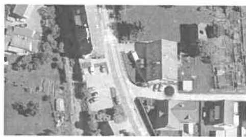
Nevarna točka na območju podružnične šole

Pri podružnični šoli Kotlje je osnovni problem premalo parkirnih površin pri šoli, vendar ima sedaj možnost parkiranja pri večnamenski dvorani Kolje.