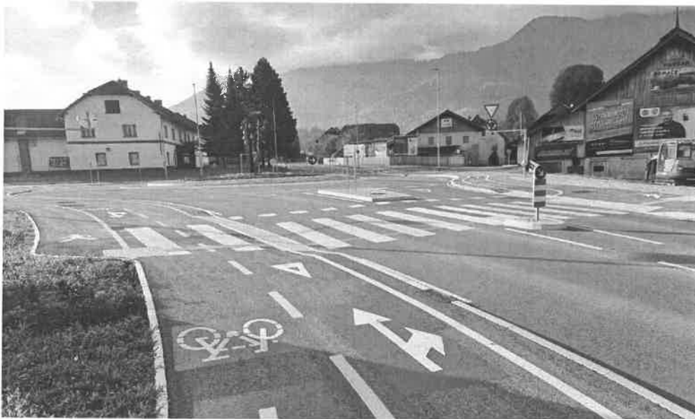
2. Odcep za Kotlje 1